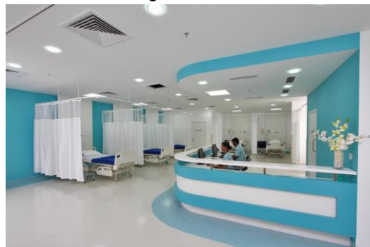
Mehrbettzimmer im Columbia Asia