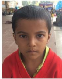
Diuman 6 Years