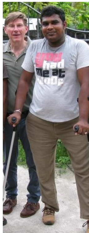
Udithe mit neuen Krücken, 2015