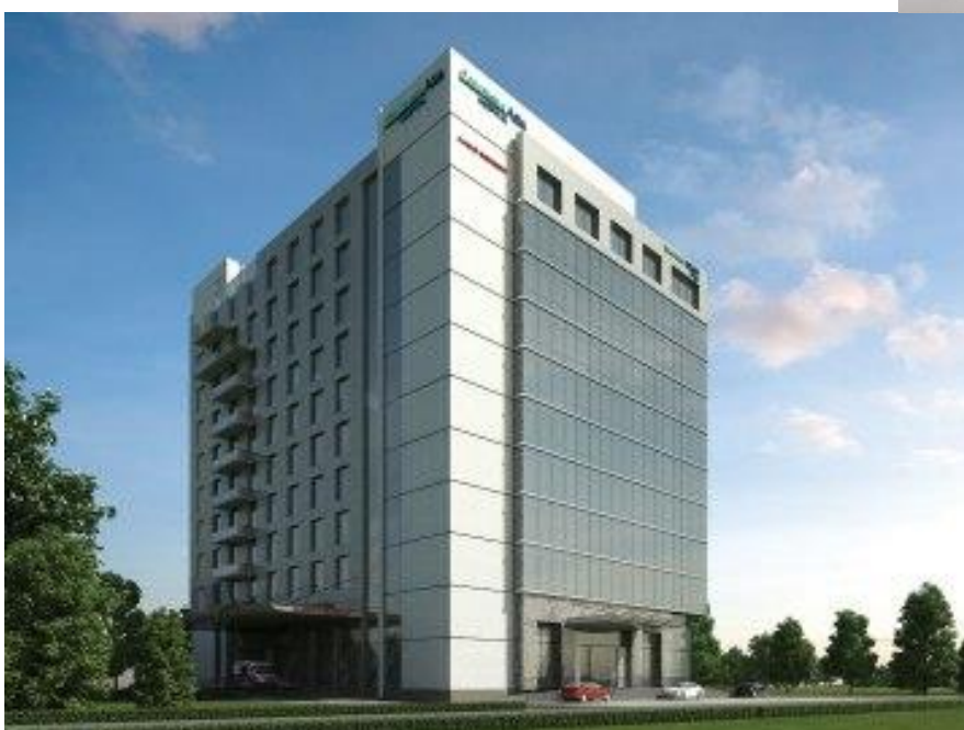
Das Columbia Asia Hospital in Bangalore