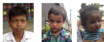
Gayadas 10 Years Saswat 5 Years Dibyansi 8 Months

surgery not necessary or in one of the next groups